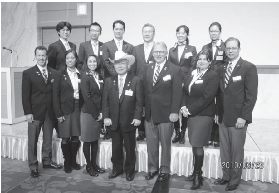
写真：3月28日（日）歓迎晩餐会 (シティプラザホテル) D5870/D2660 GSEチームメンバー集合写真

現時点ではテキサスチーム滞在第2週目ですが、地区内各RCのお世話により実りのある受け入れプログラムが無事進行中です。FriendlyでWarm Heartなメンバー達ですから素晴らしい交換体験となることと確信しています。同様に第2660地区チームもテキサスで終生忘れることのない素晴らしい体験と友情交換を実現してくれる事でしょう。