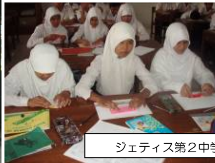
ジェティス第2中学校で事業紹介&折り紙