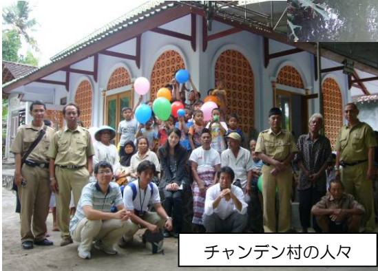
チャンデン村の人々