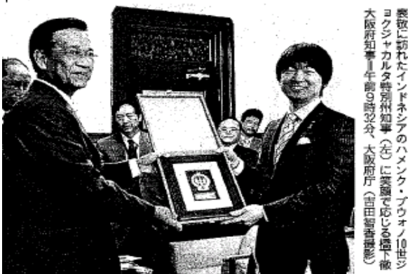
表敬に訪れたインドネシアのハメンク・ブウォノ10世ジョグジャカルタ特別州知事(左)に笑顔で応じた橋下大阪府知事(右)が、午前9時30分、大阪府庁